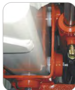
Glissières sur tampons avec rattrapage de jeu

Montées sur glissières elles prennent toutes les balles cubiques de toutes sections de 0,80m à 2,20m pesant jusqu'à 1500 kg.