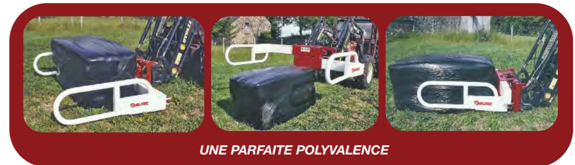
UNE PARFAITE POLYVALENCE

Les mains puissantes de la PC20 saisissent les balles en long ou en travers.