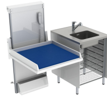
Table à langer électrique à hauteur variable 334-081-1