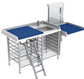
Table à langer électrique 334-083-1