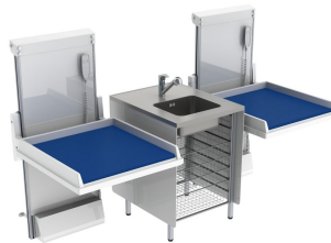
Table à langer électrique 334-082-1