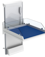
Table à langer électrique à hauteur variable 334-081-0