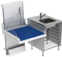
Table à langer électrique 334-082-0