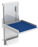
Table à langer électrique à hauteur variable 334-080-1