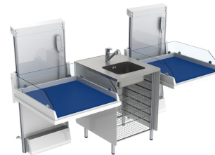
Table à langer électrique 334-083-0