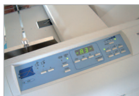
Panneau de commande avec affichage digital