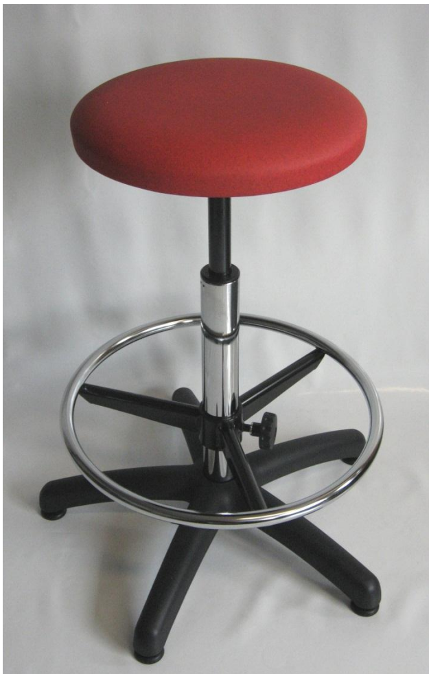
Visuel du tabouret N13 avec repose-pieds RPTL

Pour faciliter le nettoyage et la décontamination, le dessous de cette assise est recouvert par une feuille de vinyle étanche. L'assise, qui ne comporte pas d'agrafe, est exempte d'impuretés.