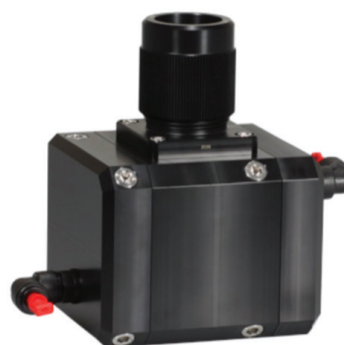
Cellule de mesure pour installation By-Pass