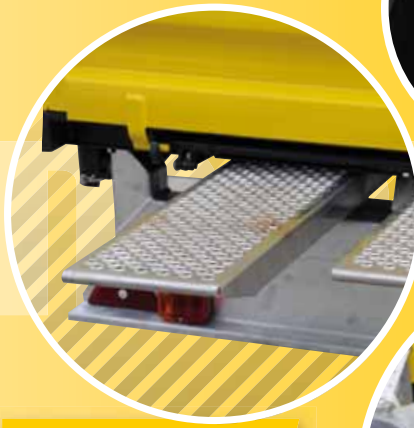
2 AUFFAHRBOHLEN ASCENDING BOARD PLANCHE EPAISSE DO MONTER

Der geringe Wartungsaufwand macht dieses Gerät so pflegeleicht und zuverlässig wie alle matev-Produkte. TRL – ein langlebiges Gerät in bewährter matev-Qualität.