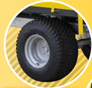
3 RÄDER 26x12.00-12 TYRES 26x12.00-12 PNEUS 26x12.00-12