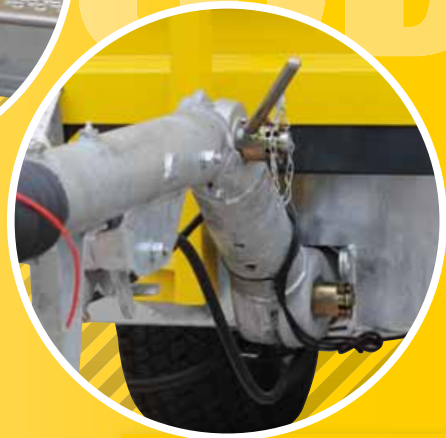
4 HÖHENVERSTELLBARE DEICHEL HEIGHT-ADJUSTABLE DRAWBAR TIMIN RÉGLABLE EN HAUTEUR

Low maintenance requirements make these implements as easy to care for and reliable as all matev products. TRL – long-lasting implements in proven matev quality.