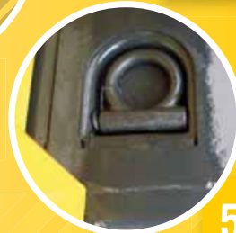
5 ZURRÖSEN LASHING RINGS ANNEAU D'ARRIMAGE

Le faible entretien nécessaire rend ces appareils aussi résistants et fiables que tous les autres produits matev. TRL – des outils durables dans la qualité matev éprouvée.