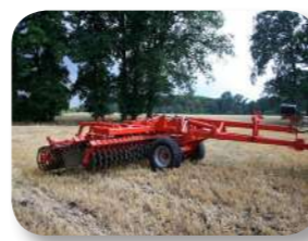
Travail directe sur des chaumes