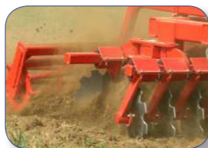
Position optimale des disques