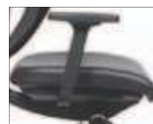
Rembourrage en cuir avec coutures décoratives