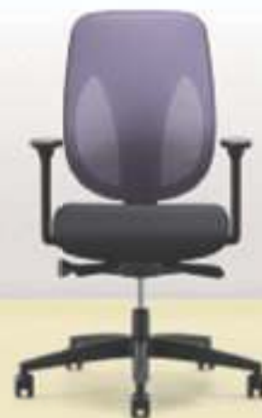
353-8029 → Dossier résille → Accoudoirs fixes → Roulettes 65 mm