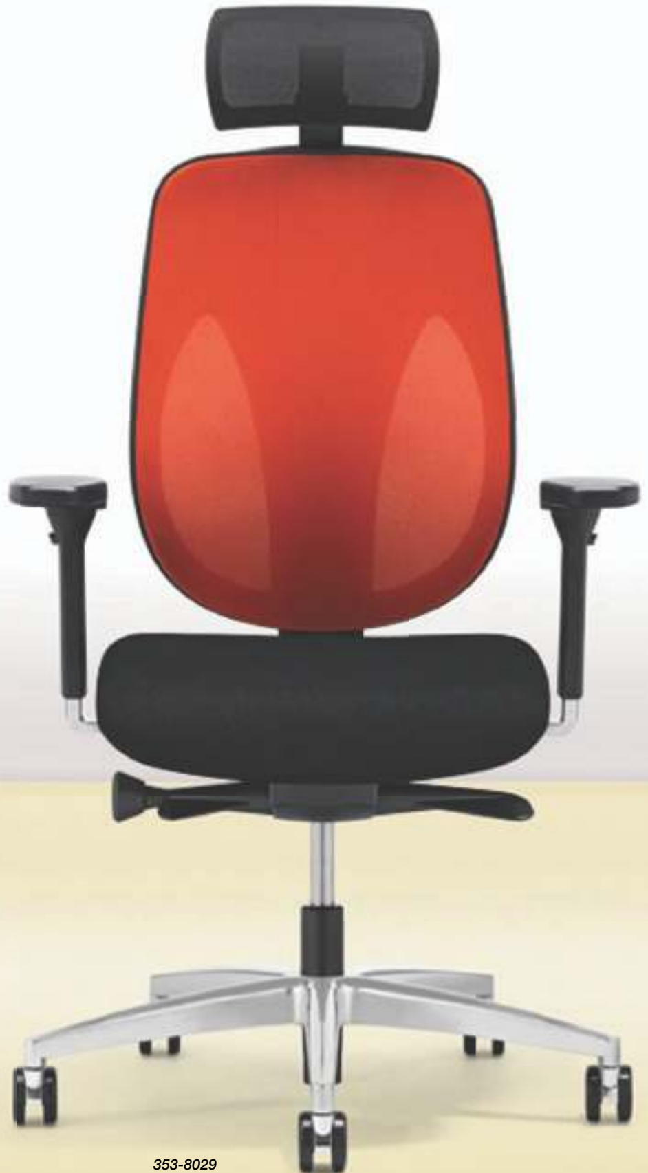
353-8029 → Dossier résille → Appuie-tête → Accoudoirs 4D → Piètement à 5 branches en aluminium poli → Roulettes 65 mm, chromées