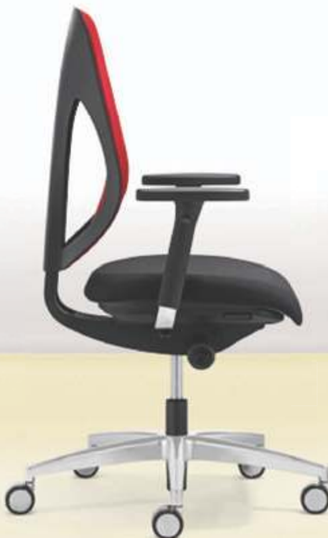
353-8029 → Dossier résille → Accoudoirs 4D → Piètement à 5 branches en aluminium poli → Roulettes 65 mm, chromées