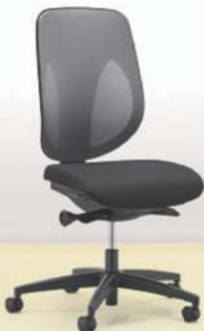
353-4029 → Dossier résille → Roulettes 50 mm

giroflex 353 : disponible avec tricot 3D dans des variantes de coloris attractives. Disponible en option avec réglage de l'inclinaison de l'assise vers l'avant, cintre et appuie-tête. Disponible au choix avec accoudoirs fixes, 2D ou 4D. Avec piètement à 5 branches en matière synthétique noire ou en aluminium poli.