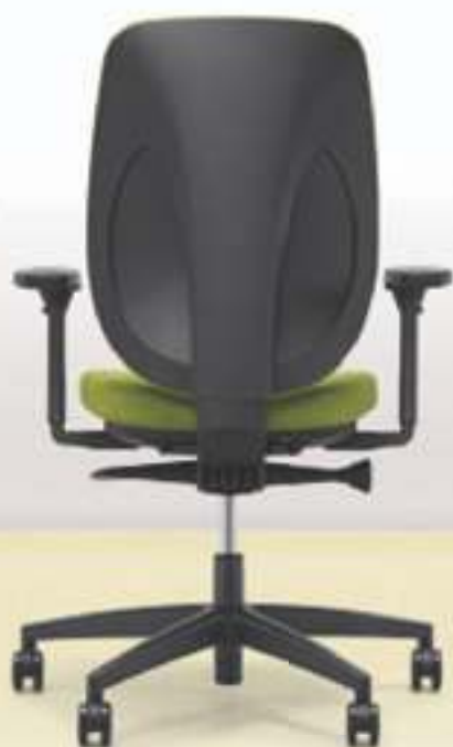
353-8529 → Dossier rembourré → Accoudoirs 4D → Roulettes 65 mm