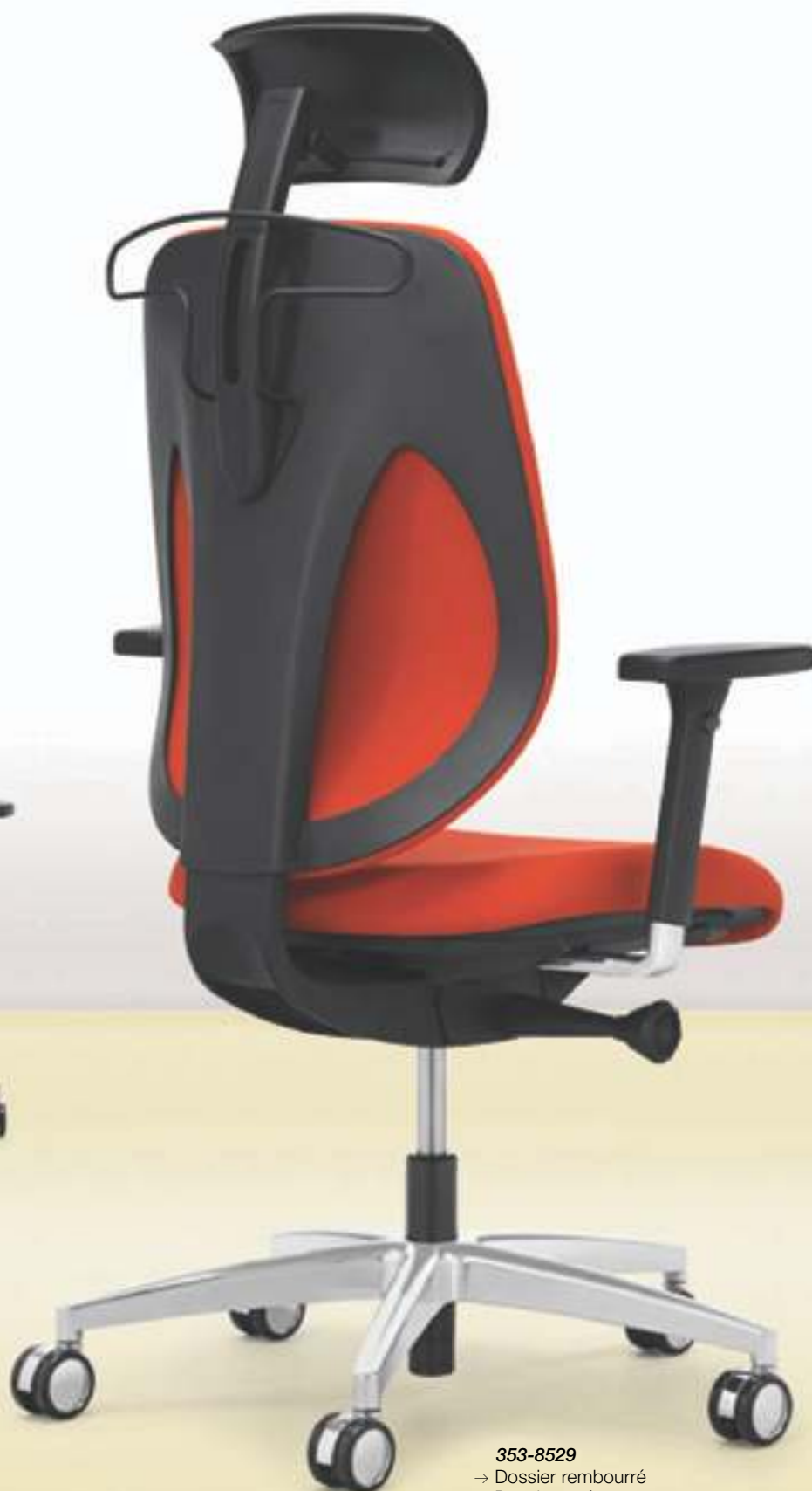
353-8529 → Dossier rembourré → Dossier revêtu → Appuie-tête → Cintre → Accoudoirs 4D → Piètement à 5 branches en aluminium poli → Roulettes 65 mm, chromées