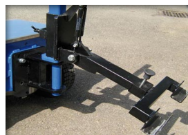
Attelage sur mesure