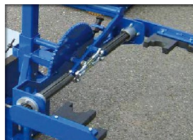
Attelage à pince