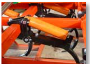
Régulation pression dents