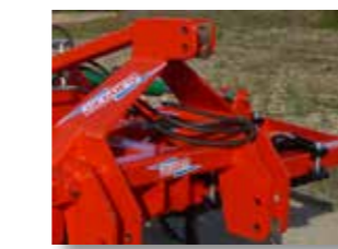
Accrochage troisième point