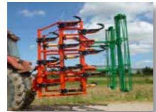
Nouveau système de pliage