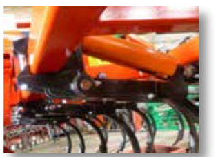
Bâtiment renforcé avec tube structurel