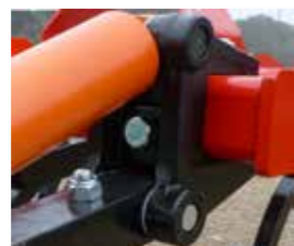
Accrochage des dents au bâtiment