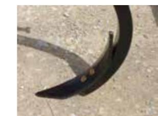
Soc réversible d'acier au bore