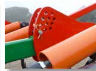
Système régulation rouleau