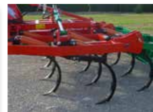
Trois files de dents