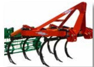
Deux files de dents