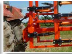
Accrochage au troisième point