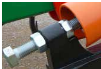
Système régulation pression ressorts