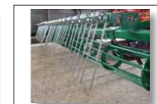
Herse avec ressorts de 10 mm