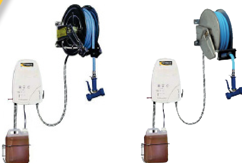
Ref. 20 m: CNETC/1F Ref. bi-produit: CNETC/2F