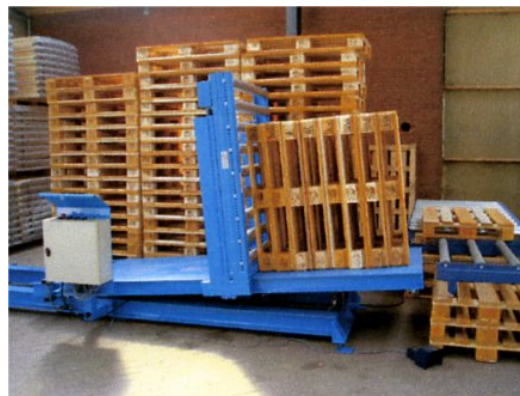
Position de contrôle des palettes

Avec le basculeur Cekamon , il est possible très facilement et sans gros effort physique de basculer une pile de palettes à contrôler afin de les trier. Il n'est pas utile avec le basculeur de porter ou tirer les palettes. Dans la position horizontale, le contrôle d'une face est réalisée, ensuite il suffit de laisser tomber la palette sur le train de rouleaux pour contrôler l'autre face.