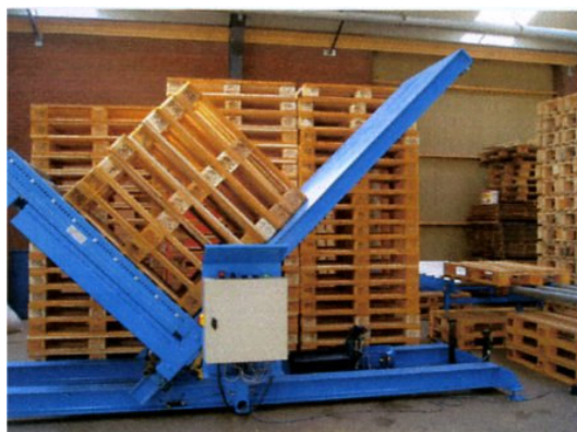
Basculement de la pile