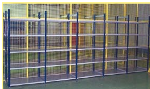
Avec échelles ouvertes