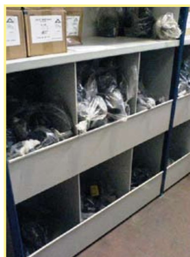
Pour pièces en vrac