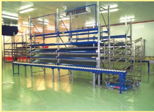
Transporteur à rouleaux libres intégré pour l'aide à la préparation