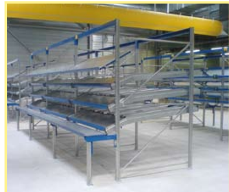
Tablettes de prélèvement inclinées