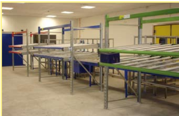
Cadre droit sans tablette