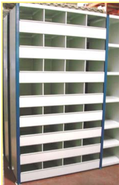
Avec séparateurs et avants de casiers