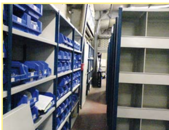
Avec échelles tôlées pour bacs