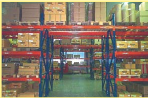
Stockage palettes et charges lourdes