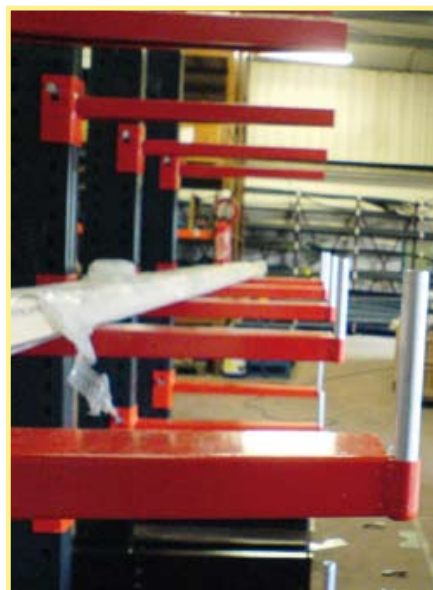
Stockage de charges longues type CANTILEVER