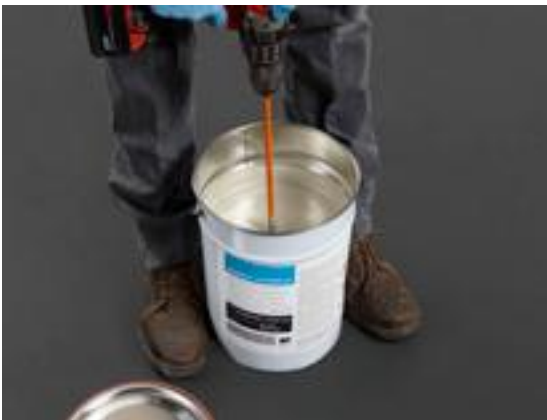
1. Mélangez le produit dans son emballage d'origine.

La résine RENOLIT POLIQUID et le primaire d'accrochage RENOLIT POLIQUID sont activés avec RENOLIT POLIQUID catalyseur.