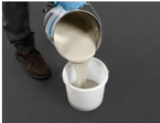
2. Déterminez la quantité de résine ou de primaire nécessaire. Ne préparez pas plus de matériau que la quantité qui peut être mise en œuvre dans le délai de durcissement.