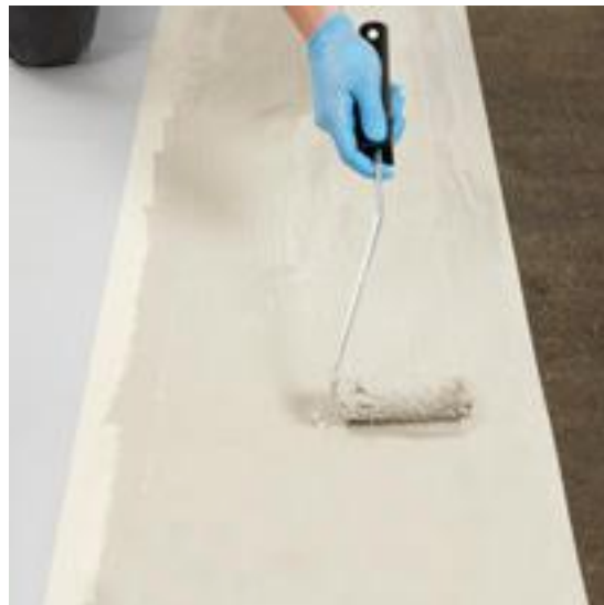
Raccord entre une étanchéité en PVC et une étanchéité bitumineuse