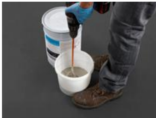
4. Mélangez consciencieusement (2 à 5 minutes, en fonction de la température).