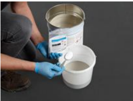
3. Ajoutez la bonne quantité de catalyseur en suivant les instructions sur l'emballage.