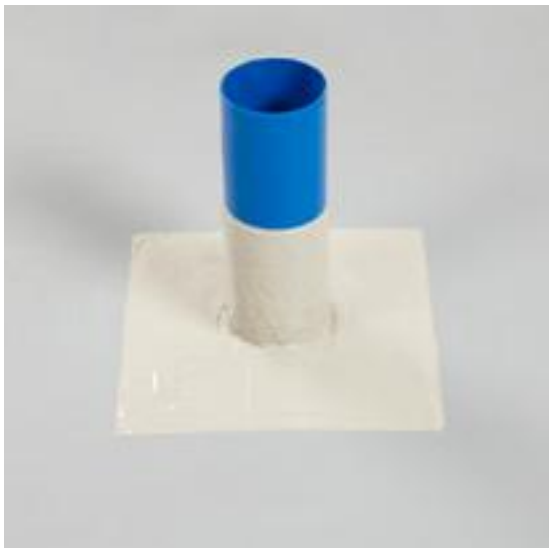
Raccord d'une sortie de toiture