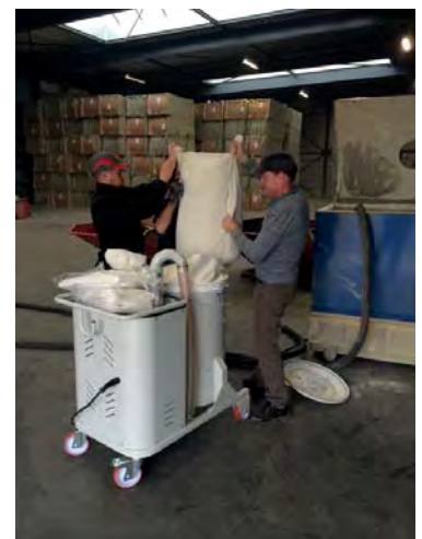
Vidange de l'aspirateur verticale