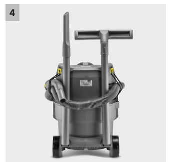
4 Léger et dimensions compactes