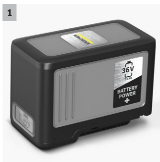
1 Batterie puissante Power+ 36 V d'une capacité de 7,5 Ah