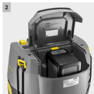
2 Boîtier de protection pour le compartiment à batterie