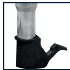
Piqueur à loquet