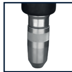
Piqueur vis double filet