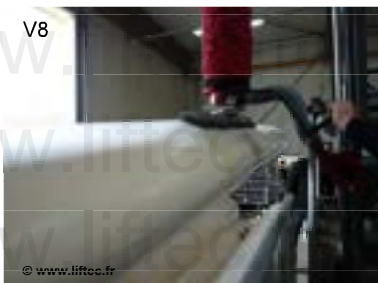
VL160 Ventouse allongée pour rouleau de tissu