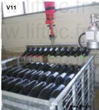
Prise de bouteilles

avec turbine électrique ou pompe Venturi