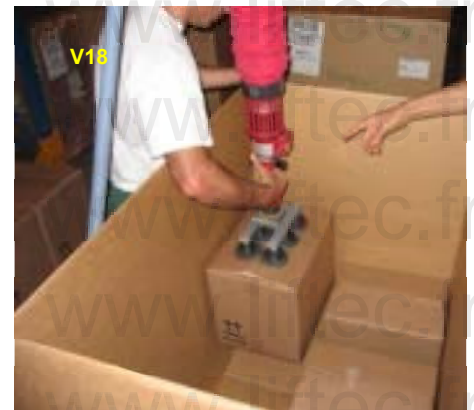
Prise de cartons