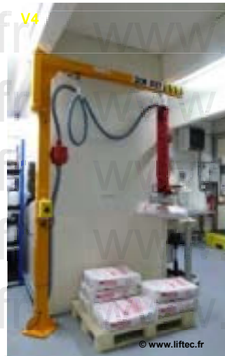
VL 140 Prise sac