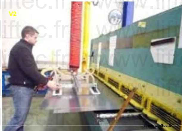
VL160 Prise de tôle