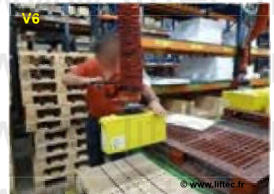
VL180 Prise de batterie 100 kg