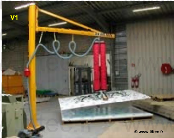
VL 200 Prise de tôle