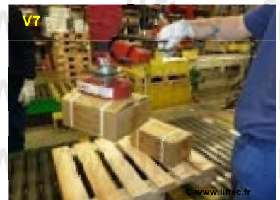
VL140 Prise de carton batterie