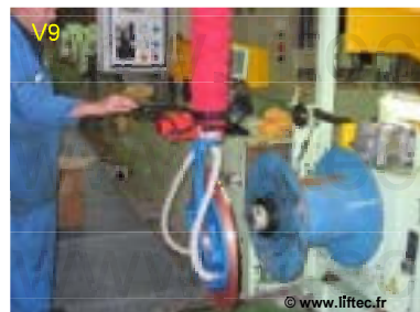
VL120 Basculeur de bobine ou disque