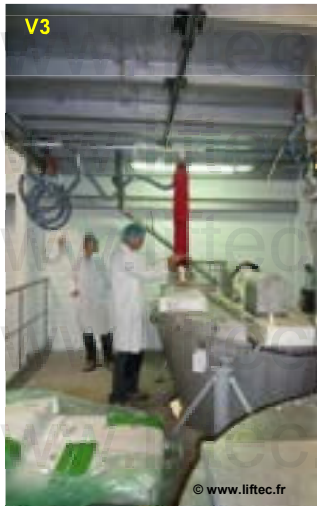
VL120 + poutre roulante