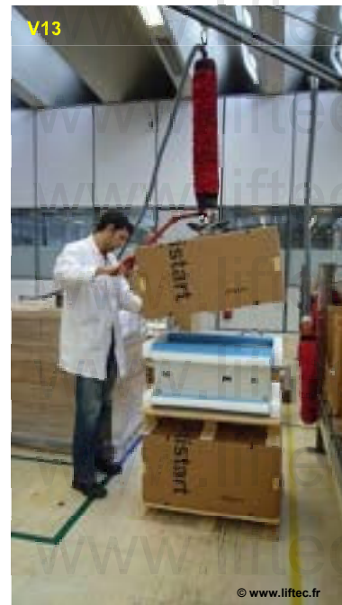
Prise de cartons