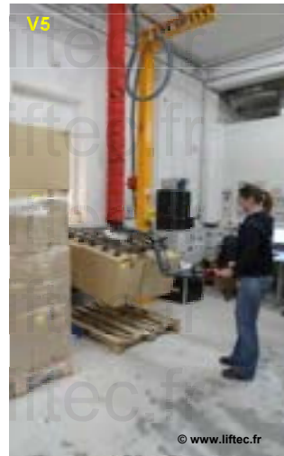
VL180 Prise de 5 cartons