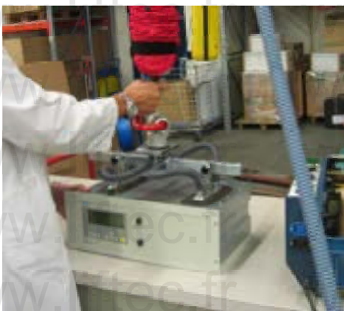
Prise tôle acier