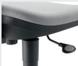
Mécanisme 3 réglages classique 3 standard adjustments mechanism Mecanismo 3 regulaciones clásicas