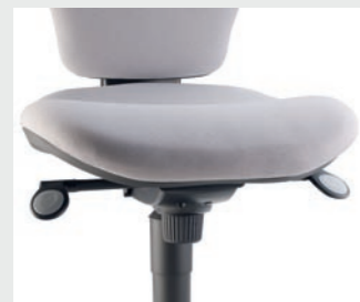
Mécanisme synchrone Synchronized mechanism Mecanismo sincronizado