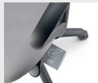
Tirette avec notice d'emploi Plastic leaf with using instructions Lengüeta con instrucciones de uso