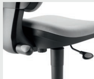
Mécanisme contact permanent Permanent contact mechanism Mecanismo contacto permanente