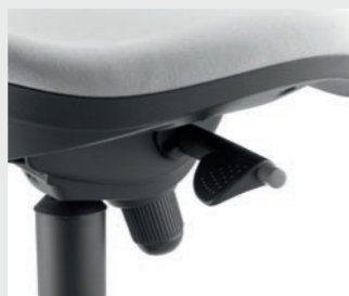
Mécanisme contact permanent "Plus" Adjustable permanent contact mechanism Mecanismo contacto permanente "Plus"