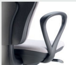
Accoudoirs fixes Fixed armrests Brazos fijos