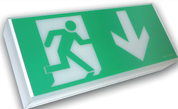
Pictogramme fourni séparément