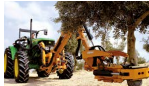
Travail rapide, efficace et respectueux de l'arbre

Rhône-Alpes - MIRABEL AUX BARONNIES - FRANCE