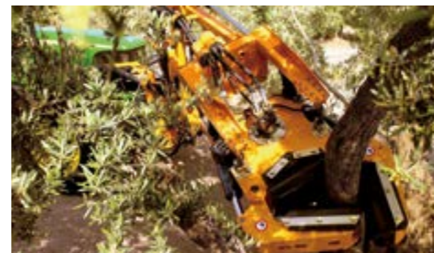
F100 avec pince trois mors