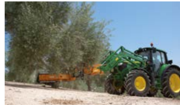
Dégagement important, le tracteur ne roule pas sur les olives tombées au sol