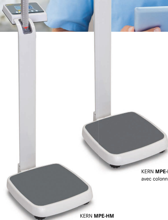
KERN MPE-PM avec colonne