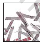
Coupe croisée 2 x 15 mm Niveau de sécurité DIN 4 Documents confidentiels ou secrets.