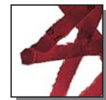
Coupe croisée 4 x 40 mm Niveau de sécurité DIN 3 Documents confidentiels.