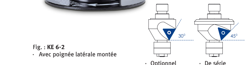
Fig. : KE 6-2 • Avec poignée latérale montée