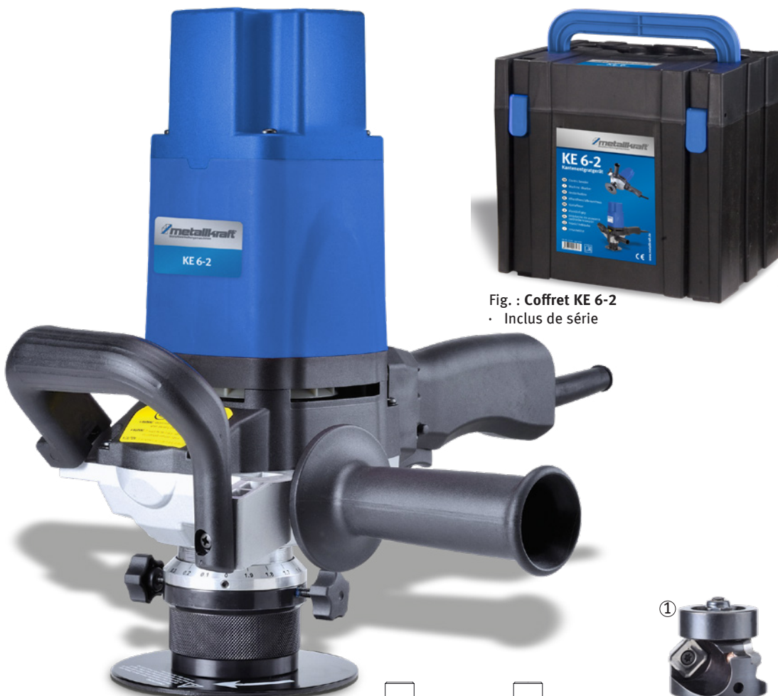
Fig. : Coffret KE 6-2 • Inclus de série