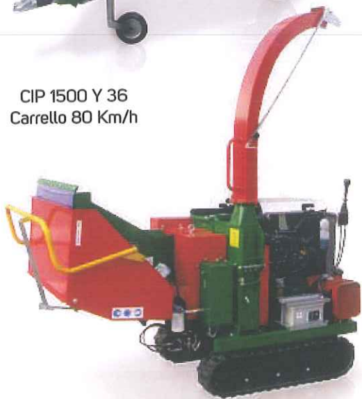
CIP 1500 Con sottocarro cingolato