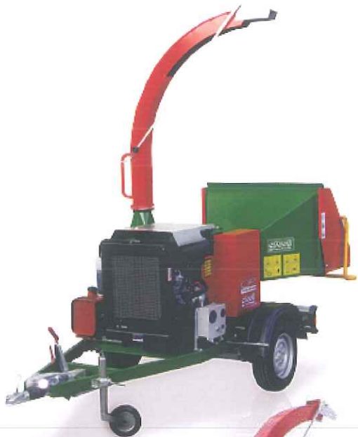
CIP 1500 Y 36 Carrello 80 Km/h