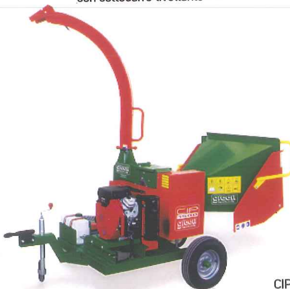
CIP 1500 H 24 Carrello 25 Km/h