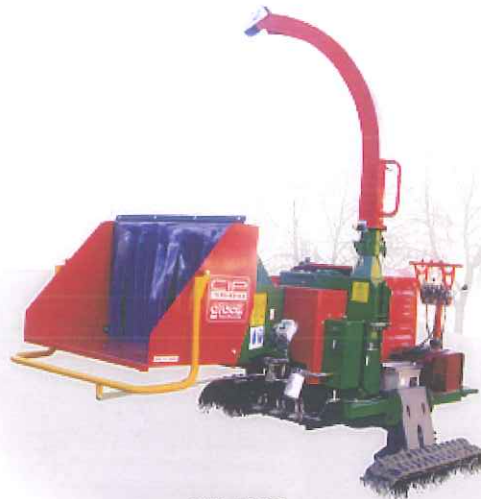
CIP 1500 con sottocarro livellante