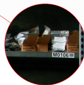
Stockage des étiquettes