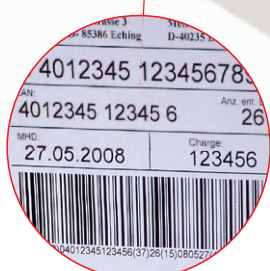
Étiquetage des cartons et des palettes