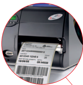
Picking et Préparation de commandes