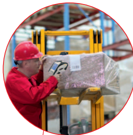
Réception de marchandises