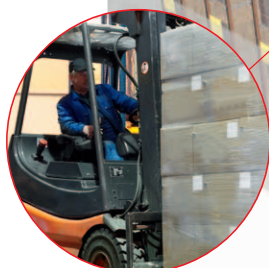
Étiquetage de gondoles