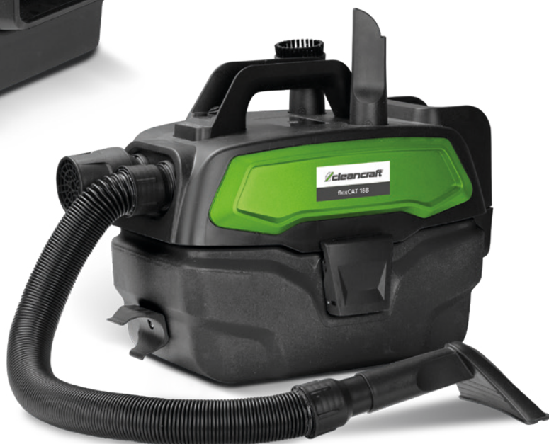
Fig. : flexCAT 18B