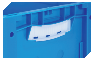
Obtrateurs pour poignées ouvertes pour bacs gerbables norme Europe, série XL d'une hauteur de 170, 220 et 270 mm 43-31450