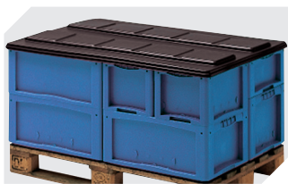
Coiffes pour conteneurs palettisés l 1220 x l 820 mm 9-18421