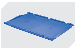
Couvercles indépendants pour bacs gerbables norme Europe, série XL l 400 x l 300 mm 43-20303