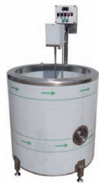
CUVES DE CUISSON À GAZ GPL/METHANE CAP. 75 – 400 L