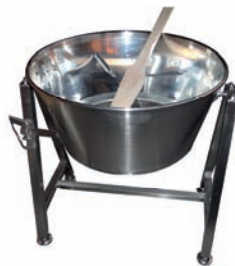
CUVES POUR LA CASÉIFICATION DE LA PÂTE FILÉE FRAICHE/ MOZZARELLA