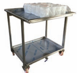
TABLE DE DRAINAGE AVEC/SANS MOULES