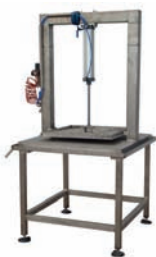
PRESSE POUR FROMAGE PNÉUMATIQUE