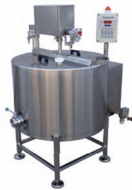
CUVES DE CUISSON MULTIPOWERED CHAUFFAGE ÉLECTRIQUE/ VAPEUR CAP. 50 – 500 L