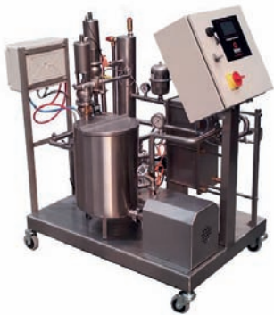
PASTEURISATEUR À PLAQUES COMPACT ÉLECTRIQUE CAP. À PARTIR DE 500 L/H