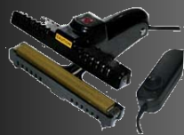
Pinces à Souder