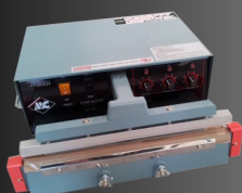
Soudeuses de Table Thermiques ou à Impulsion