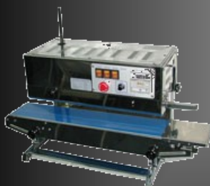
Soudeuses en Continu Horizontales et Verticales