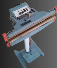
Soudeuses sur pied Thermiques ou à Impulsion