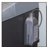
Lubrification automatique du bloc de coupe