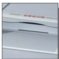
Ouverture pour CD/DVD-ROMs