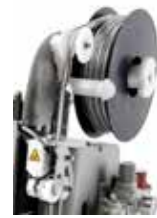
Clips en rouleau