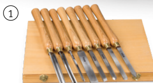
Fig. : Jeu de 8 outils à bois · En option

Retrouvez les caractéristiques des accessoires en page 912