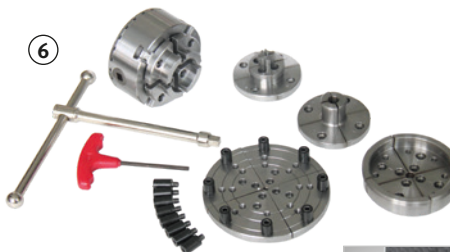
Fig. : Set Premium 4 mors · Ø 95 mm · En option