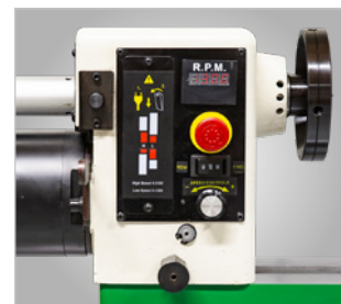
· Visualisation du régime de vitesse par tachymètre digital