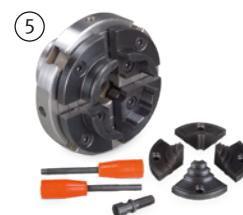
Fig. : Kit mandrin 4 mors, · Ø 100 mm · Mors interchangeables · En option