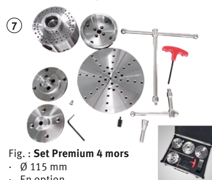
Fig. : Set Premium 4 mors · Ø 115 mm · En option