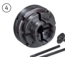
Fig. : Mandrin 4 mors · Ø 100 mm · En option