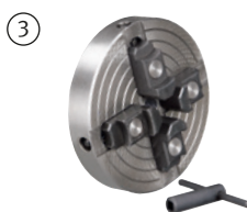
Fig. : Mandrin 4 mors indépendants · Ø 150 mm · En option