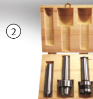
Fig. : Jeu de griffes d'entraînement · En option