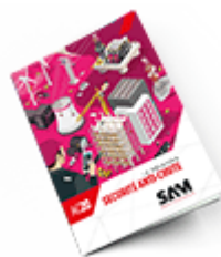
Sécurité anti-chute 2020