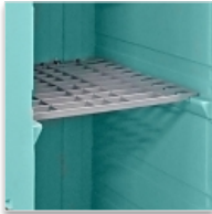
Une grille plastique relevable