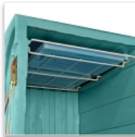
Grille support plaque eutectique