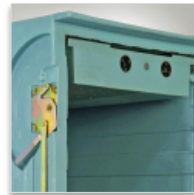
Bac à neige carbonique SIBER SYSTEM® produits frais et surgelés