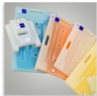
Plaque eutectique TOP 370