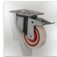
2 roues à frein Ø 100 mm