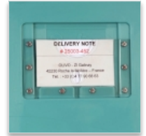
Porte étiquette encastré