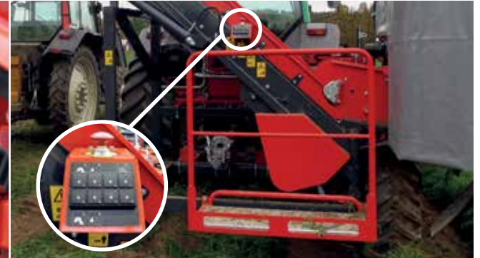
PLATE-FORME DE TRIAGE

Nettoyeurs rotatifs à entraînement hydraulique si un nettoyage plus intensif est requis (en option).