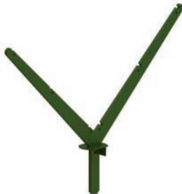
Bavolet double (3 fils par bras)

Le bavolet est un accessoire qui s'installe dans le prolongement du poteau, permettant de renforcer la sécurité en dissuadant les éventuels intrus. Le bavolet GIGA simple peut être orienté à l'intérieur ou à l'extérieur du site.