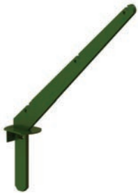
Bavolet simple (3 fils)