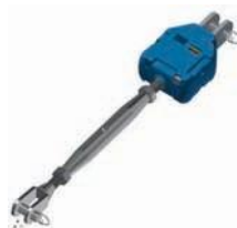
Tendeur + Pré-régleur