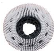
CA 742059 Brosse de lavage