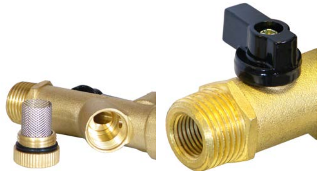
Vanne à bille et tamis intégrés