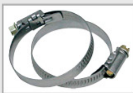
Collier de serrage Ø20-32 386060