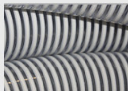
Tuyau Ø25 100914