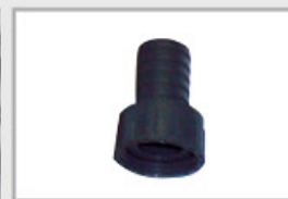
Raccord 1"x25 110709