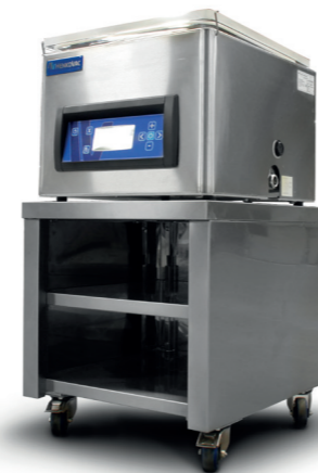
CABINET POUR T2, T3 & T4

GAMME DE NOS MACHINES DE TABLE T2, T3, T4