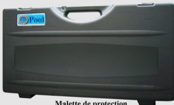
Malette de protection

Signal vidéo : NTSC / PAL , 640 x 480. Vidéo :30 images /seconde Balance automatique des blancs Eclairage avec 8 Leds blanches.