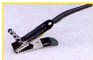
SS Clip air