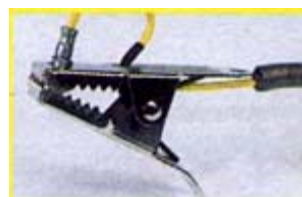
SS Clip surface