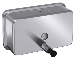
En inox 304 (18/10) Brossé Poli Satiné HyperPolish : AX9408