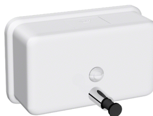
En inox 304 (18/10) Laqué Blanc : AX9408W