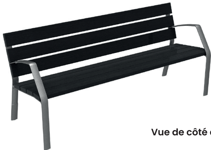
Vue de côté droite