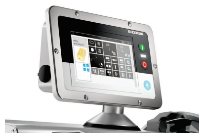
Afficheur tactile configurable