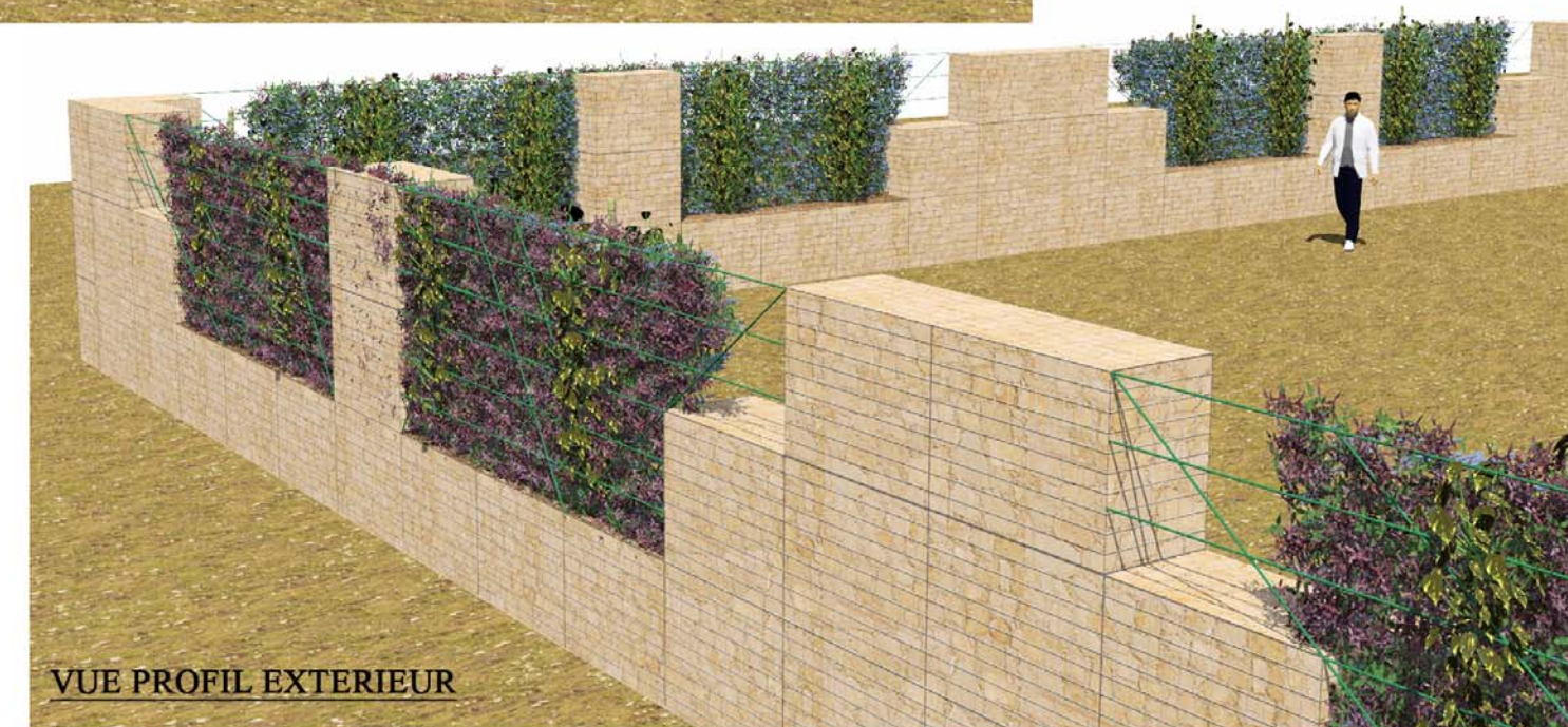
VUE PROFIL EXTERIEUR