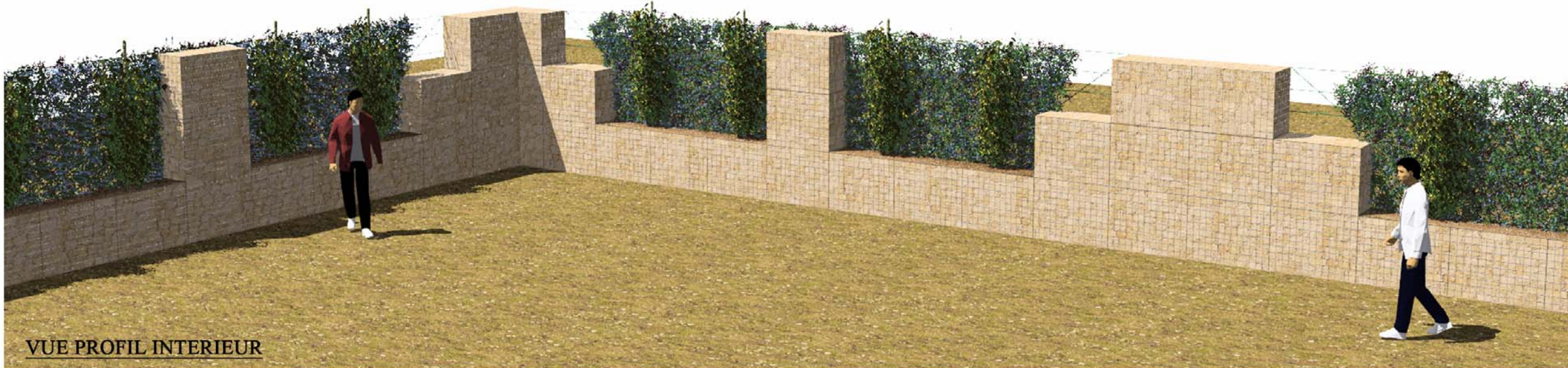
VUE PROFIL INTERIEUR