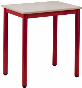
Table scolaire simple 1 ou 2 personnes