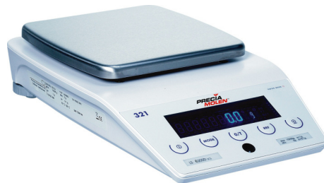
LS 4200C LS 3200D LS 6200D